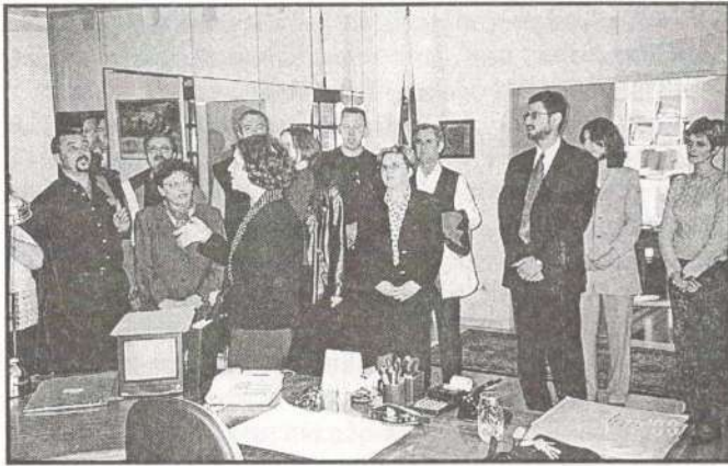
Samostojni nastop v cerkvi mesta Carme (blizu Capelladesa)

- 22. do 28. 08. 2000 - gostovanje v Cataloniji (Capellades - mesto blizu Barcelone), kjer smo izvedli dva samostojna koncerta in skupni krajši nastop v združenem zboru CORO D'EUROPA (sodelovali so še Italijani, Danci, Švicarji in zbor gostitelj iz Capelladesa).