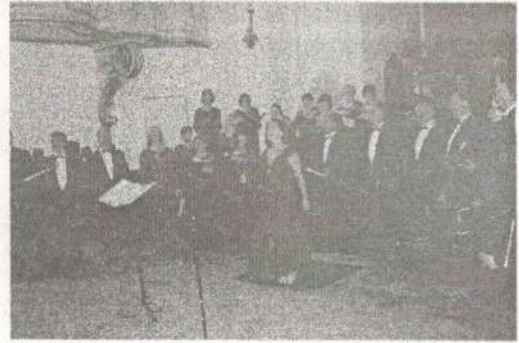
SINGING CHOIR "ADRIATIC" "ISTRIAN MUSICIANS" FOLK GROUP "OLJKA"