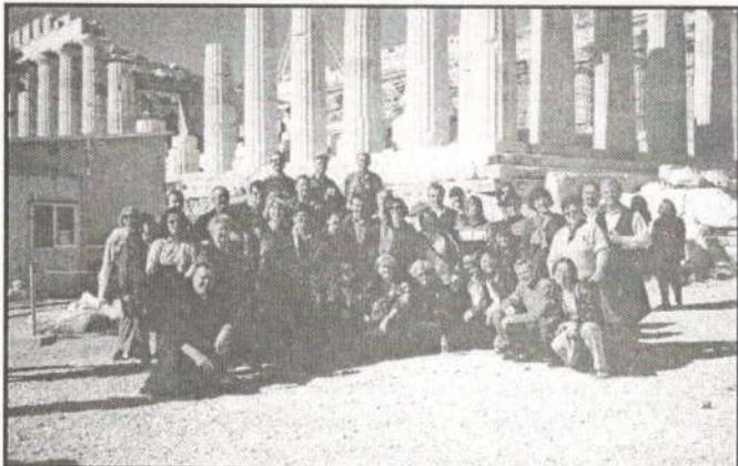
Nasmeh februarškemu soncu na Akropoli (Atene)

- 04. - 09. 02. 2000 - gostovanje v Atenah: 8. februarja dopoldan nastop za učence osnovnih in srednjih šol v American Community School, srečanje s Slovenci predstavniki na našem veleposlaništvu, zvečer celovečerni koncert v počastitev slovenskega kulturnega praznika v dvorani Athens Municipal Theatre; obakrat je navzoče pozdravil slovenski veleposlanik v Atenah g.